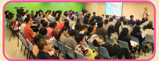
誰為男女定分界？探討《性別承認》諮詢講座